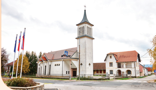
Župnijska cerkev Marijinega Brezmadežnega spočetja, Grahovo

(Povzeto po knjigi: Andrej Majcnen, vietnamski don Bosko, l. 1993.)