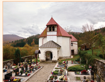
sv. Štefan, Podštebrk