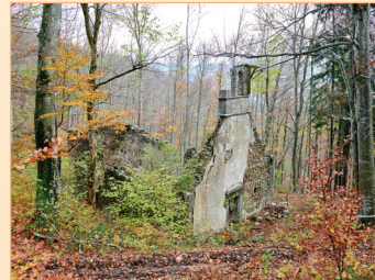
sv. Miklavž, Slinvica