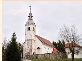
Spreobrnjenje apostola Pavla, Žerovnica