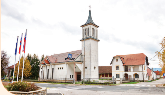
Župnijska cerkev Marijinega Brezmadežnega spočetja, Grahovo