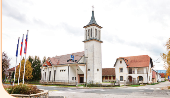
Župnijska cerkev Marijinega Brezmadežnega spočetja, Grahovo