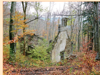
sv. Miklavž, Slivnica