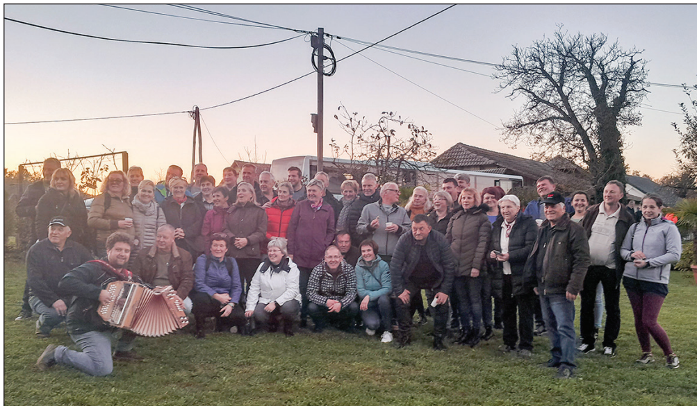
10. jubilejno martinovanje za župnijo Grahovo (Pleterje, Šentjernej, Kostanjevica – 11. 11. 2024)

Izdaja Župnija Grahovo pri Cerknici: PR 02029-0254823952 pri NLB.