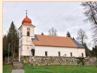
sv. Primož in Felicijan, Bločice