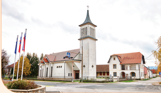
Župnijska cerkev Marijinega Brezmadežnega spočetja, Grahovo