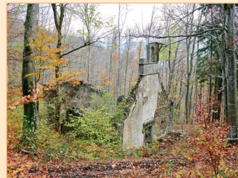
sv. Miklavž, Slivnica